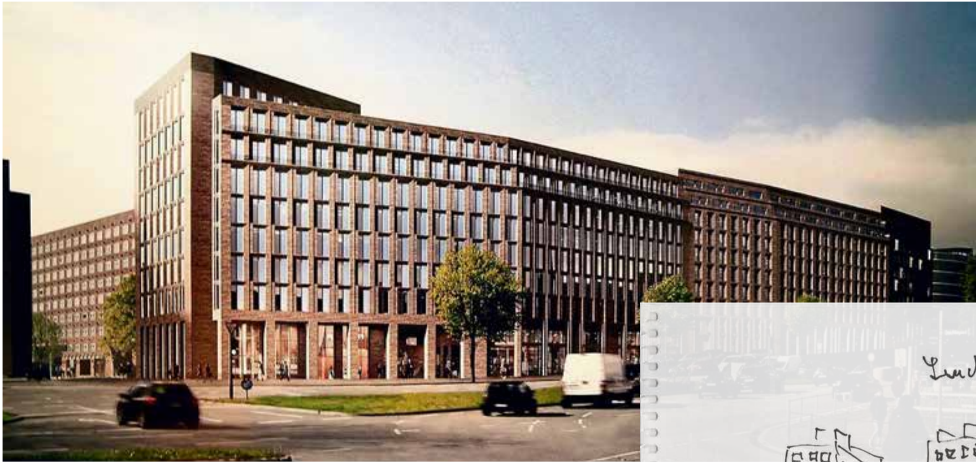
„Backsteinwurst“ Entwurf: Büro KPW Papay Warncke & Partner

Aufruf an die Hamburger Künstler*innenschaft: Der City-Hof als Leuchtturm für Kunst und Soziales